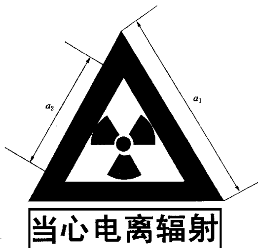
图 F2 电离辐射警告标志

电离辐射的警告标志如图 F2 所示。警告标志的含义是使人们注意可能发生的危险。其背景为黄色，正三角形边框及电离辐射标志图形均为黑色，“当心电离辐射”用黑色粗等线体字。正三角形外边 a_1=0.034L ，内边 a_2=0.700a_1 ， L 为观察距离。